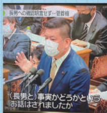
(長男と)事実かどうかという お話はされましたか