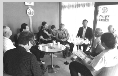
5月14日(土) 於 萩原神社参集殿

第149回 8月30日(火) 19:00~ 堺市立東文化会館講座室1 (堺市東区北野田1077-301 アミナス北野田3F)