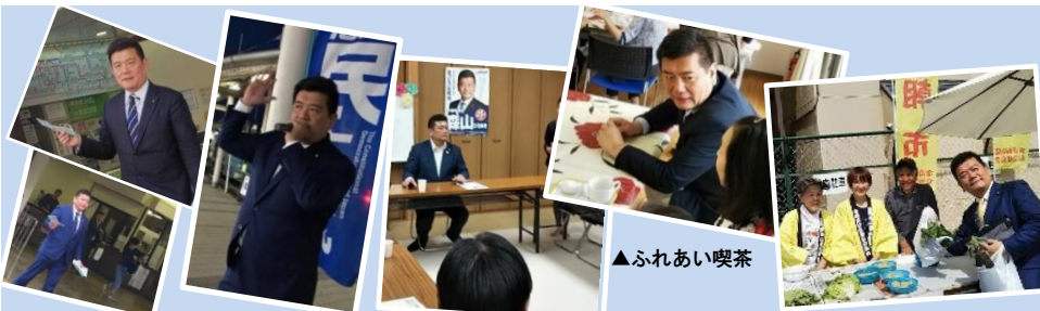
▲平日堺にいる朝は、必ず駅頭に立ち国政のご報告をしています。