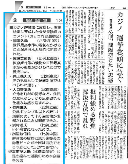
▲朝日新聞6月20日。平成28(2016)年12月7日同紙掲載。カジノ推進法案採決時の「公明党議員の賛否とコメント」にも注目してください。

選挙目当ての党利党略で、充分な議論もないまま衆議院を通過させ、国益にもならず、日本の国柄にも合わない「カジノ法」。 今後も廃案・廃止に向けて、 全力で取り組みます。