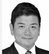
総支部長 森山 浩行